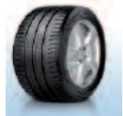
Michelin/ Energy Saver