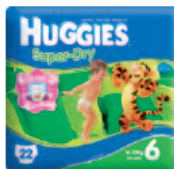
Huggies Super Dry