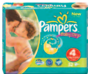
Pampers Baby Dry