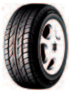
Semperit/ Comfort-Life 2