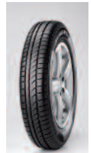
Pirelli/ Cinturato P1