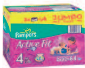
Pampers Active Fit