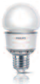
PHILIPS Economic Led