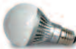
GAMMA LED verlichting