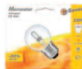
MEMOSTAR Halogen ES Ball