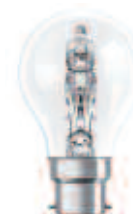
OSRAM Halogen Classic A ES 42W