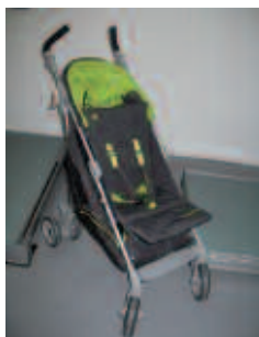
Cosatto iSpin 4 Wheel