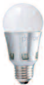
Albert Heijn LED