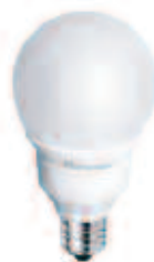
MEMOSTAR Economy Mini Globe