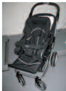
Emmalunga Nitro 4 wheel