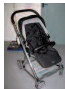
Mamas and Papas Urbo