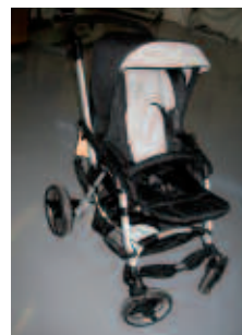
Jane Unlimit 4 Wheel