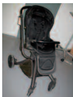
Mamas & Papas Mylo