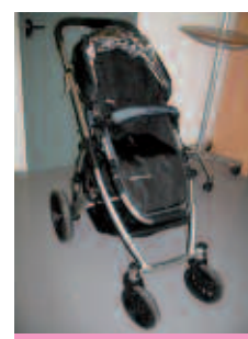
UPPA Baby Vista