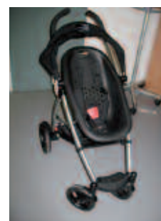
Phil & Ted's Smart