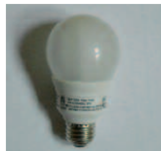
IKEA 11W bulb, GSU111