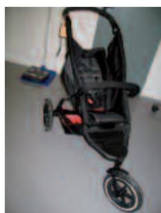
Phil & Ted's Explorer 3 Wheel